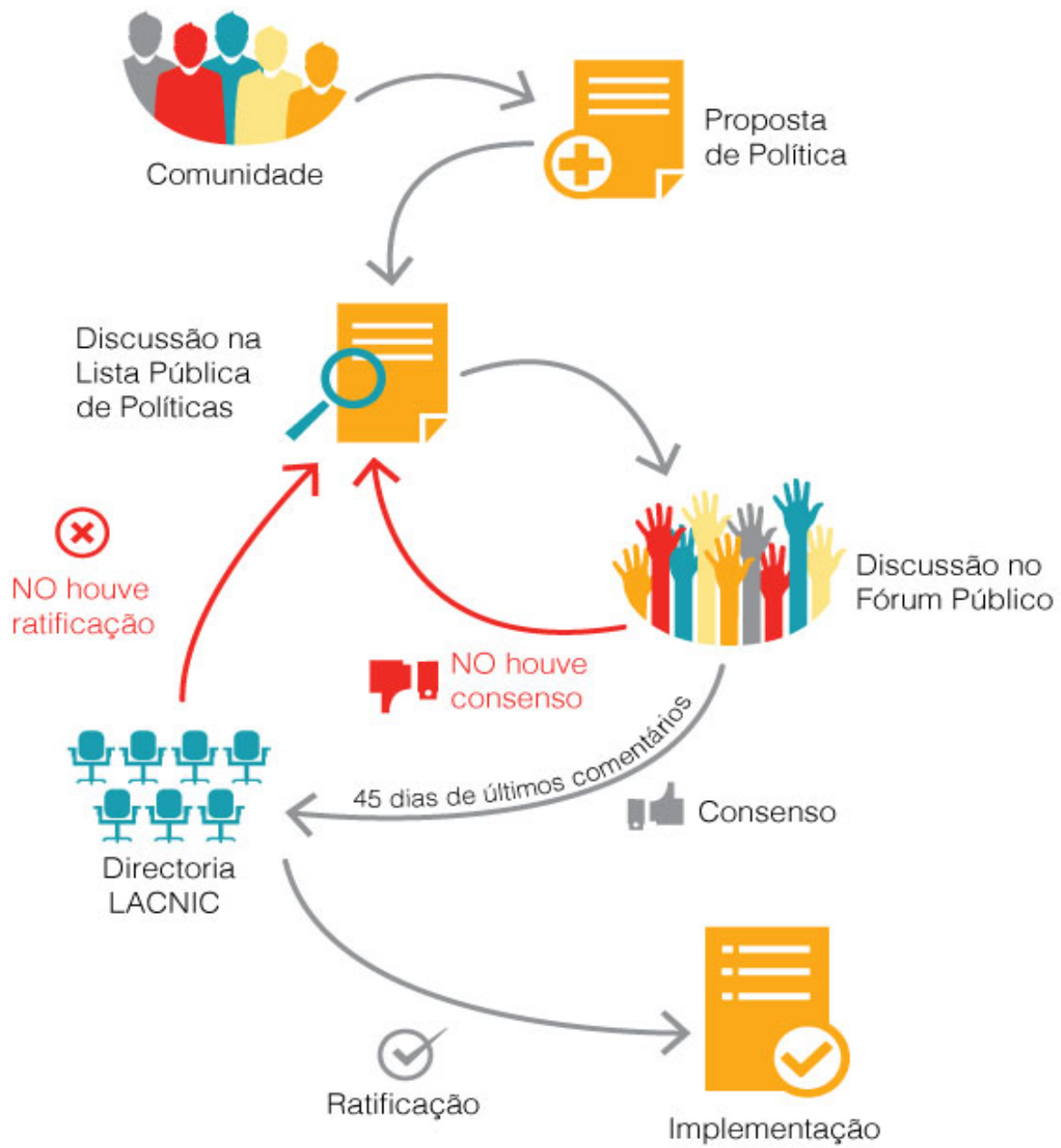
Diagrama do processo de aprovação de políticas expedito